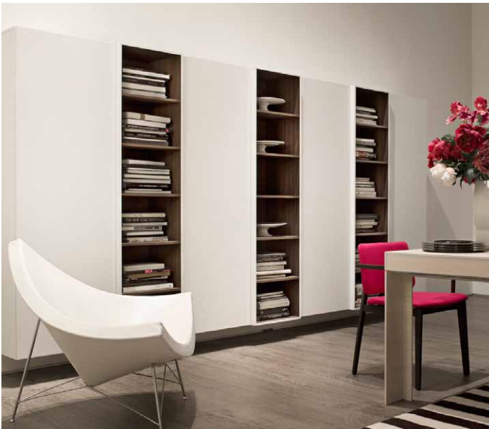
T030 Design: Piero Lissoni

Il sistema giorno Lema arricchito da un piedino in metallo per svincolarlo dal fissaggio a parete. T030 diventa ancora più versatile grazie alla possibilità di comporlo come un vero e proprio contenitore indipendente. Il dettaglio degli elementi verticali a giorno con gli esterni laccati e gli interni in larice Moka lo rendono ancora più contemporaneo ed elegante.